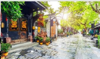
ซอยกว้างชอยแคบ