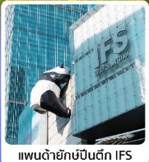
แพนด้ายักษ์ปิ่นตึก IFS

★ ภูเขาสี่ดรุณี (หุบเขาซวงเฉียวโกว) เทือกเขาแอลป์แดนมังกร