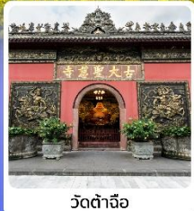
วัดต้าเจ้อ