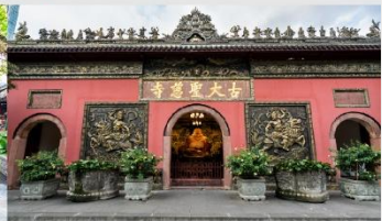
วัดต้าเจ้อ

*ทางบริษัทฯ ขอสงวนสิทธิ์ในการสลับโปรแกรมทัวร์ตามความเหมาะสมขึ้นอยู่กับสถานการณ์หน้างาน โดยคำนึงถึงผลประโยชน์ของลูกค้าเป็นสำคัญ