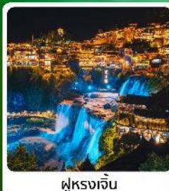
ฝู่หลงเจิ้น