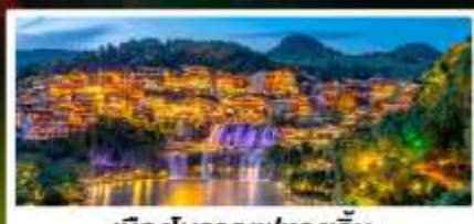
เมืองโบราณฟุทงเจิ้น