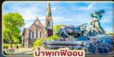
น้ำพุเกฟออน