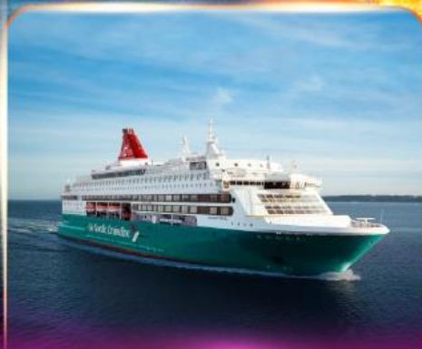
เรือสำราญ GO NORDIC CRUISE LINE