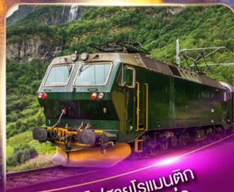
รถไฟสายโรเมนติก ฟลินส์บาน่า