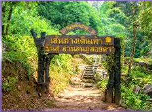
พีช 5 เป็นวัดใจ