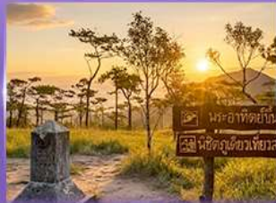
ชมพระอาทิตย์ขึ้น กุสอยดาว