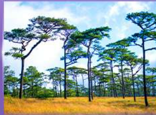
ลานสนกุสอยดาว