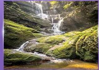
น้ำตกสายทิพย์